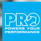
MATHIEU VAN DER POEL TEAM BKCP