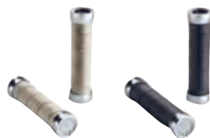
CAMBIUM Slender 手握

專用的橡膠材質車把手端塞，讓您的車把帶與車把手更加緊密結合，並提供同樣優雅、高品質的概念。