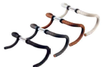
CAMBIUM 有機材質 棉布車把帶

C19為C17系列的加寬版本，使用和C17相同的製作方式，擁有相同的舒適感，僅將座墊尾端做加寬的設計，以迎合不同騎乘角度的騎乘者。