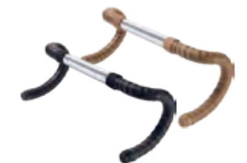
CAMBIUM 橡膠材質 棉布車把帶

CAMBIUM有機材質棉布系列車把帶使用和CAMBIUM座墊相同的棉布所製，4種顏色的車把帶與2種顏色的橡膠端塞讓您做到最一致的搭配。